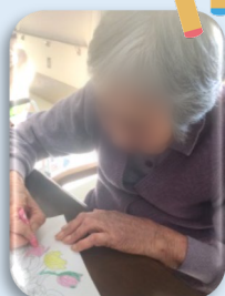
ヒ▲さまはお花の塗り絵