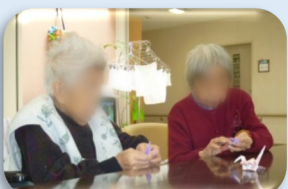
「W▲子」さまは鶴の折り方を教え合って完成でした！