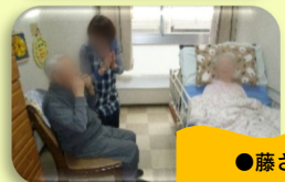
●藤さまが ハーモニカでお祝い♪

長い冬が終わり、いよいよ春本番！皆さま、毎日お元気で過ごしてましたよ！ 新しいお仲間も増え、また更に一味違った雰囲気になってきました。