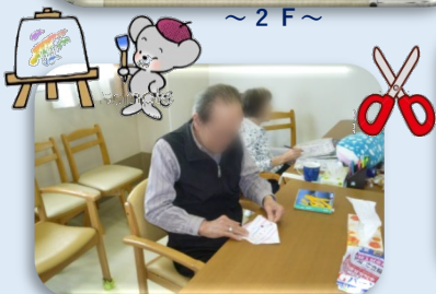
熊●さまは広告でゴミ箱を製作中。