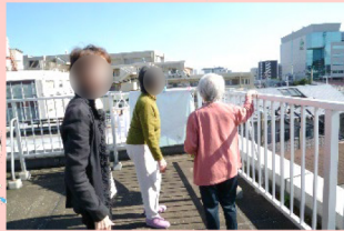
●子さま、●●さま、●子さまは屋上へお洗濯干し・・・からの日光浴です。