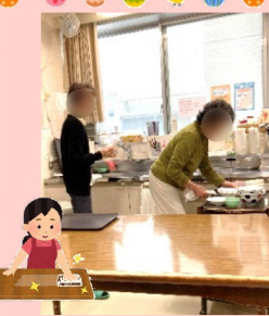
ヒソヒソと読んで下さる●●さま。●子さまは日課の新聞チェック! 手際の良いお二人です!