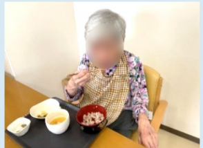
皆さまで揃っていただく美味しいですね!