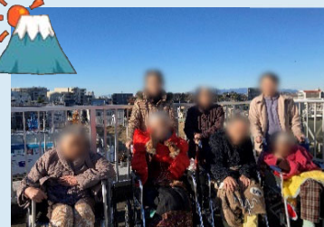
屋上では富士山がくっきり見えました。「良い年でありますように！」と手を合わせていらっしゃいました。