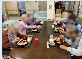
黒豆、数の子、伊達巻に栗きんとんetc..皆さまお好きな物が並びましたね！