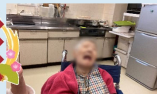
●子さま・・・今年もナイス笑顔でお願いしますね！