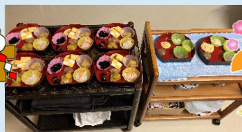
お雑煮はお餅は詰まりやすいので、きりたんぼで代用。写真撮り忘れました(涙)。