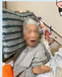
新年、最初の早起きさんは●●子さまでした！