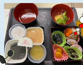
3Fのおせち料理。皆さま、ベロリでしたよ！