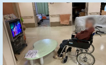
「あ！和田アキ子だ！」と●●●さま。夜の歌番組を観ておられました♪