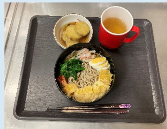
大晦日の夕食は海老天入りの年越し蕎麦でした。これで無事に新年を迎えられますね！