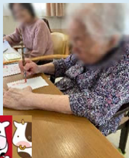
皆さまが書かれた年賀状は、届きましたか？ 本格的に筆ペンを使っておられました。