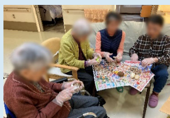
作業が早い！●●●さま、●子さま、●子さま、 守恵さま。