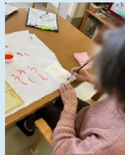
緊張気味の●●子さま。