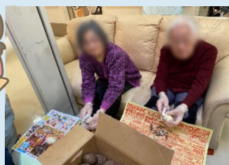
手を止めてパチリ！●●子さまと●子さま。