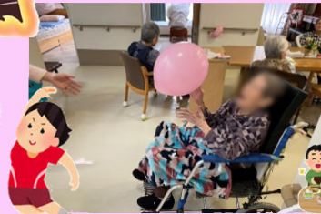
「●さん!」「はあーい!」と風船を打ち返されていました。