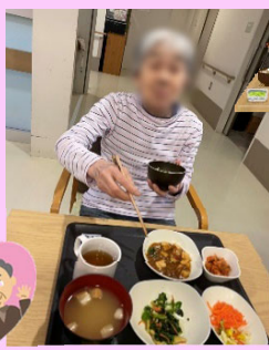
ポーズをとって下さいました♥