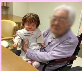
大切に大切に抱っこをして下さいました。