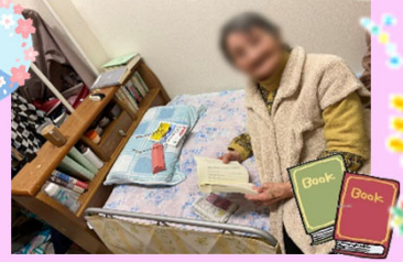
●子さまはベッドに座って読書です。