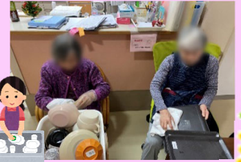
食器拭き...いつもありがとうございます!