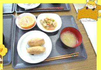
この日の昼食はお稲荷さん。揚げに酢飯を詰め込む作業でしたが、長年の主婦業をされていた皆さんにはちょよいのチョイ!であっという間に完成しました。