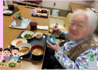
スママセン!お食事中にパチリです!