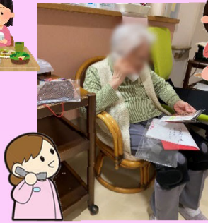
●子さま・息子様とお話が弾んでいます!