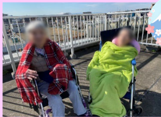
●●さま、●さま、富士山は見えませんか?!(^^)!

日中はリビングでTVを観たり、談笑や読書、ご自分のお部屋で趣味に興じるなど、皆さまご自由に過ごされています。