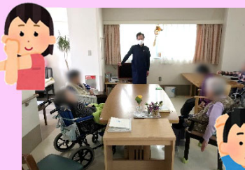
「はい!右足をあげて-!」男性スタッフSさんのストレッチレクです!