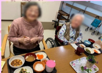
●●子さまと●子さま。いつも仲良くお話をされていますね!