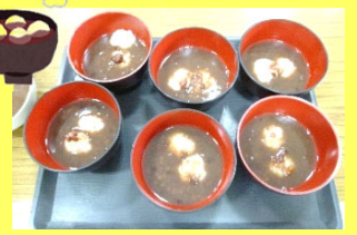
お餅は危険!ご飯を潰した「なんちゃっ てお餅」でお汁粉をいただきました!