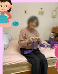
●子さまは次の作品ですね!楽しみにしています!