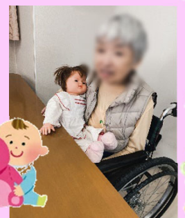
「のぞみちゃん」をあやす●子さま。