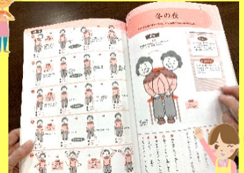
●●●さまが熱心に読んでいらっしゃる本は、 なんと!「介護リハビリ読本」でした(笑)