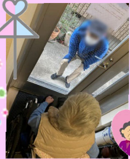
愛するご主人のご面会♥●子さま。