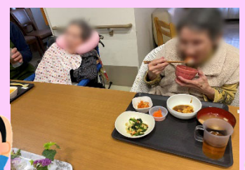
たくさん召し上がって、体調管理バッチリですね!