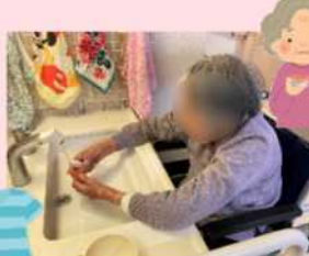
ご自分の入れ歯をフラシで洗っている●●さま。