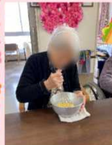
●子さまにゆで卵を漬けていただきました。