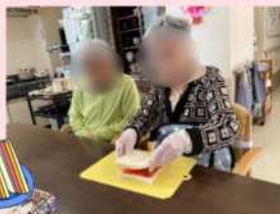
皆さまが見守る中、とくあさまは ジャムサンドを合体! 見事成功!