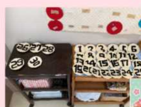
4月のカレンダーの日付セットです。「これはここよ!」「それ、ちがうちがう!」など、とても賑やかにやってもらいました。