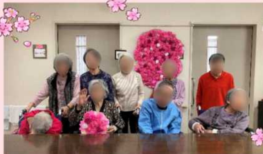
桜の前で皆さま集合です! 大人数の写真撮影は難しい! まあ、味があって良いかしら(笑)