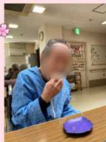
写真を撮った後はお顔をいただきますながらお花見をしました。