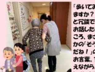
で行かれた●●●さま。あと数日で100歳です!

「歩いてみますか?」と冗談でお話したところ、まさかの「そうだね!」のお言葉。支えながら、トイレまで歩い