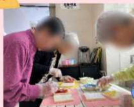
卵を揉んだり、ジャムを塗ったり。 ●●さま。●子さま。●子さま。