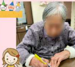
ご自分のお名前をしっかりと書いてもらいました。