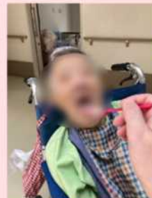
この日の昼食は、皆さまが作ったサンドイッチ。早速試食です! 言うまでもなく、美味し過ぎる! ぜーんぶ完全! ご馳走さまでした!