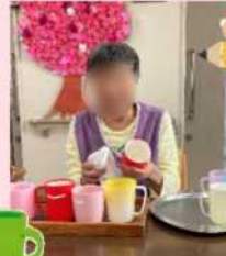
「何か手伝おうか?」と仰って下さった●●さま。