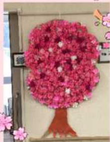
とても大きな桜の木。満開です!