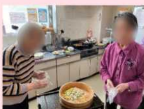
この日の昼食はちらし寿司。●●さまと●子さまに具を混ぜていただきました。そして皆さまの前でお皿に盛り付けをしました。