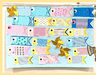
沢山のこいのぼり。気持ちよさそうに泳いでますね!