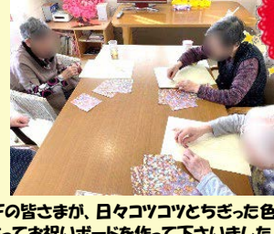
3Fの皆さまが、日々コツコツとちぎった色紙を貼ってお祝いボードを作って下さいました!