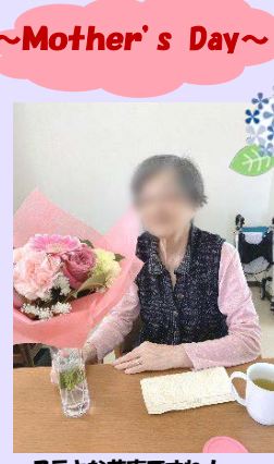
ステキな花束ですね!