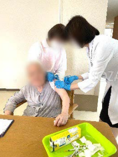
皆さま、無事に2回の接種が終了しました。ひとまず安心ですね!