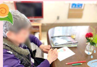
●●さま、ステキなカーネーションの絵が描けましたね!