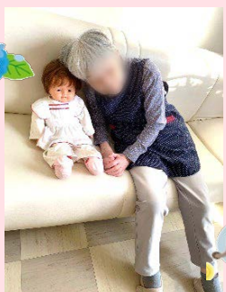
「のぞみちゃん」と休憩中の●●さま