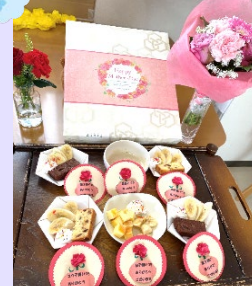
5/9は母の日。いつもありがとうございます!