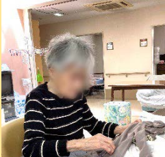
お洗濯物を畳んで下さる●●さま