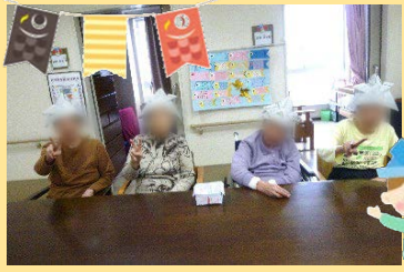
新聞紙で兜を作りました。被ったの持ちっとうん十年ぶりなのでしょうね!