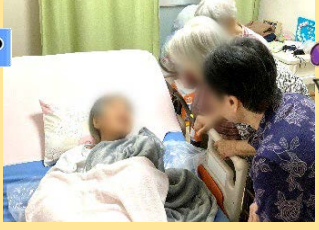
●●さま、●●さま、●●さまはお部屋で休まれていた●●さまのご様子を見に訪問です。「●●ちゃん、大丈夫?」とお声をかけていらっしゃいました。