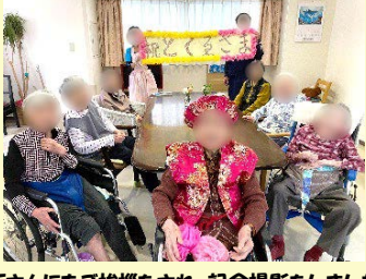
3Fさんにもご挨拶をされ、記念撮影をしました