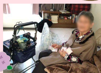
お孫様からお花とお手紙のプレゼントをいただいた●●さま