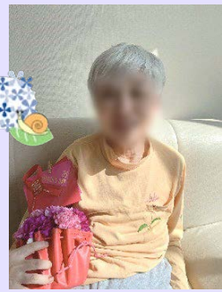
●●さま...ニコニコです!