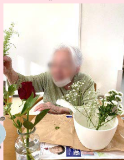
お花を生ける●●さま。センス抜群です