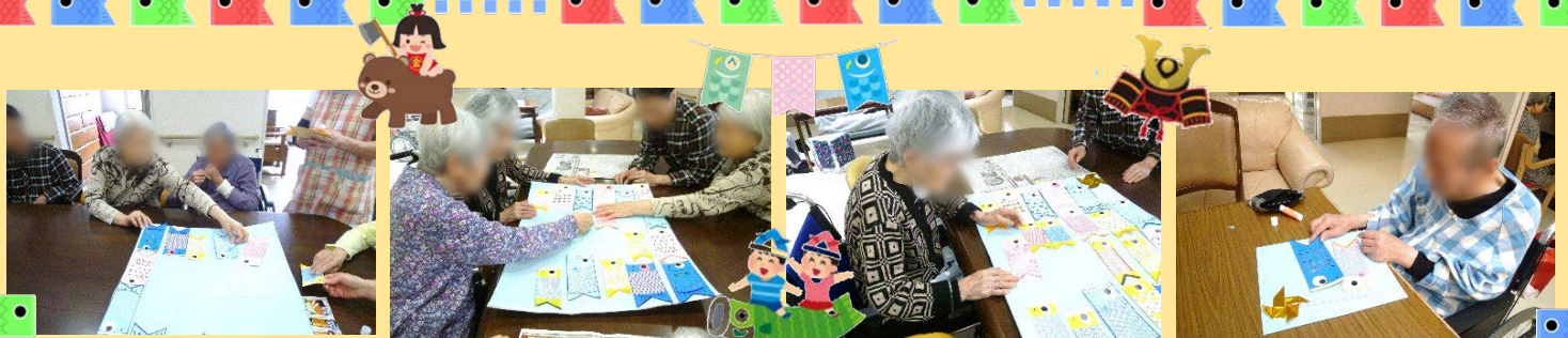
大きな空一面に、沢山のこいのぼりを泳がせました。手際よく貼る方、よく考えて貼る方様々でした。季節を感じて頂ける様なフロアにしていきたいです!