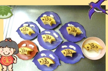
おやつはバームクーヘンでこいのぼり!