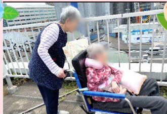
●●さまと●●さま、屋上へお散歩です