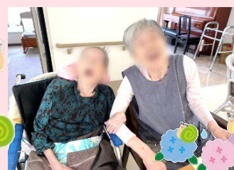
「なんだか楽しい!」●●さまと●●さま