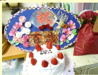
ケーキ、ボードも特製です!