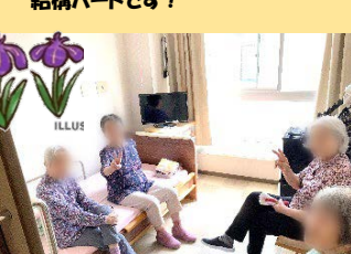
ある日の午後、●●さまのお部屋で座談会が行われてました