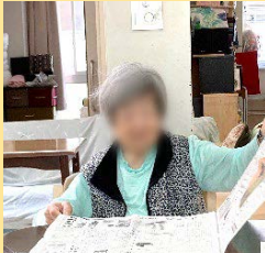
●●さま、●●さまに大量の新聞をたんでいただきました