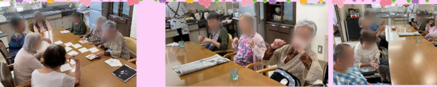
屋食前のリズム体操は毎日頑張ってます！