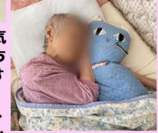
お昼寝中の●子さま♡