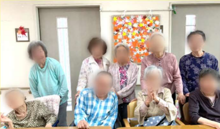
恒例の集合写真。毎回7チャ7チャです！