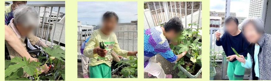
皆さん、花が咲いては喜び、小さな実が付くとドキドキして待ちに待った収穫では大喜びでした！