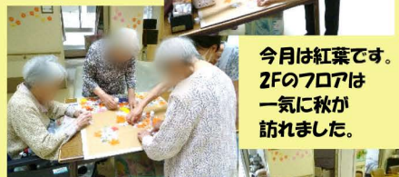
今月は紅葉です。 2Fの70号は 一気に秋が 訪れました。