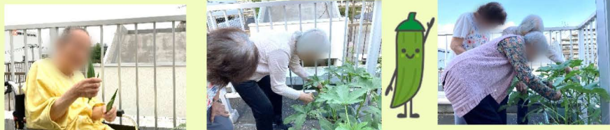
「ほら！ここにあるわよ！」と、収穫するのも大騒ぎ(笑)。

以前、のぞみ通信にお野菜の種を蒔いた事は お伝えしましたが、沢山のオクラを収穫する 事ができました！毎日皆さんで水やりをし、 花が咲いたと喜ばれ、小さな実が日に日に大 きくなるのを見守りやっど収穫。 収穫されたオクラはそのまま食卓へ！ 和え物、煮物、お味噌汁にと姿を変えて皆さ んでいただきました！次は何を植えましょうか ね？