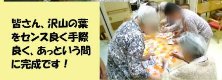
皆さん、沢山の葉 をセンス良く手際 良く、あっという間 に完成です！