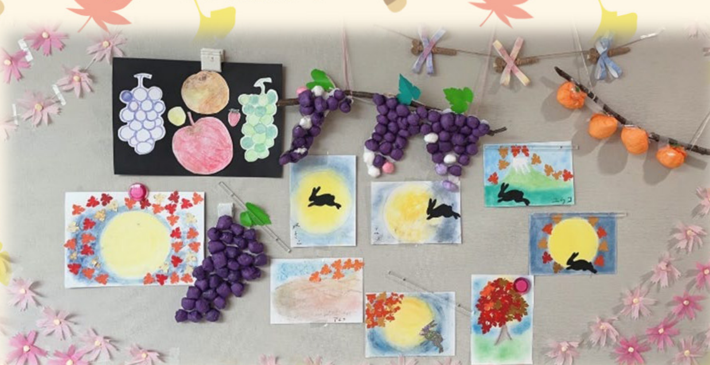
↑●●子さまは2作品。富士山と満月🌕