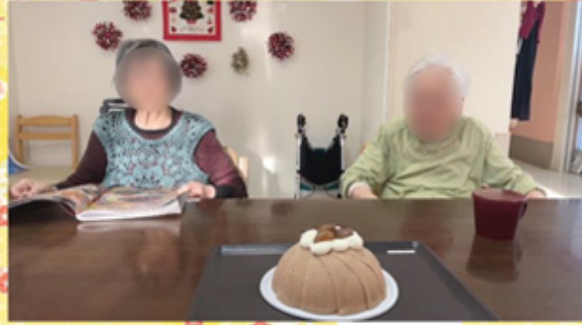
←クリスマスケーキは皆さんでいただきました!