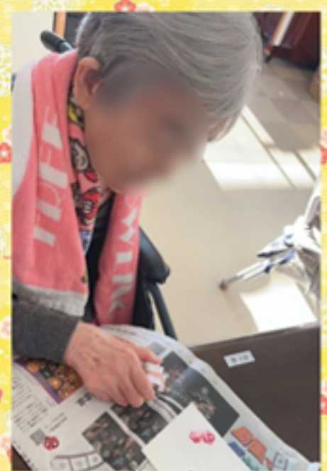
オクラスタンプで新年のご挨拶をご家族の方に送りました。お好きなようにスタンプぼんぼんと「世界でたった一つ」の年賀状ですよ！