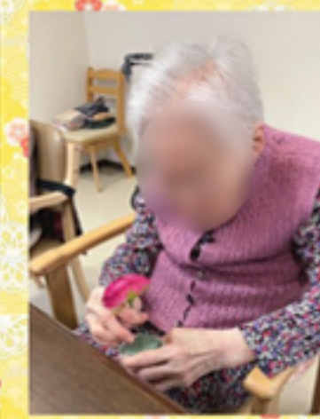
お正月のフラワーアレンジメント。造花ですがご自由にアレンジされてました🌸