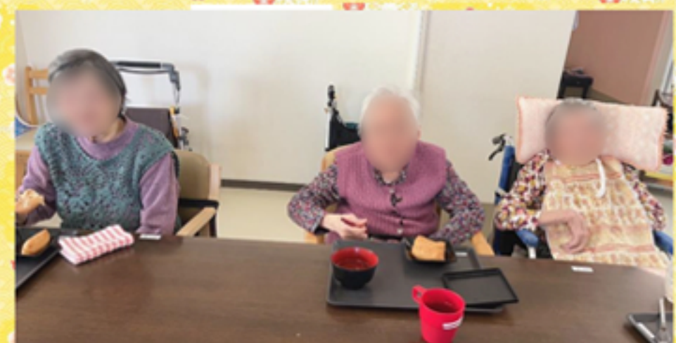
おせちをいただきながらも、普段と変わらない朝。その「自然さ」が一番いいですね！今年も毎日お元気でよろしくお願いしますね♪