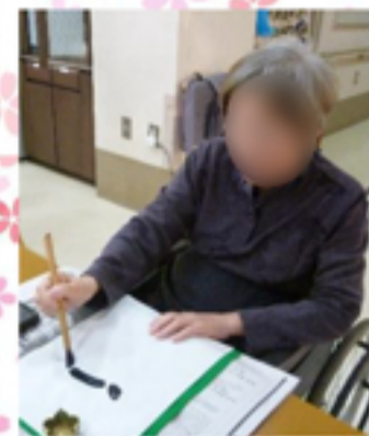
お正月と言えば書き初め。スラスラと書かれる方、何度も書き直しをされる方、皆さん個性豊かで素敵な作品ができてあがりましたよ！