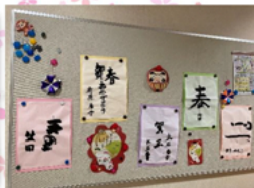
ちょっとした隙間時間に鶴を折りました。指先のリハビリは大事ですね！ 元旦はおせちで「おめでとう！」でした。 フロアは皆さんの書き初めです！