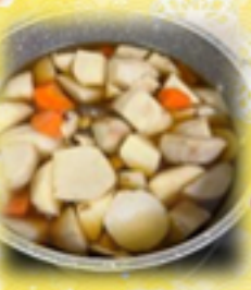
おせちをいただき無事に新年を迎える事ができました！