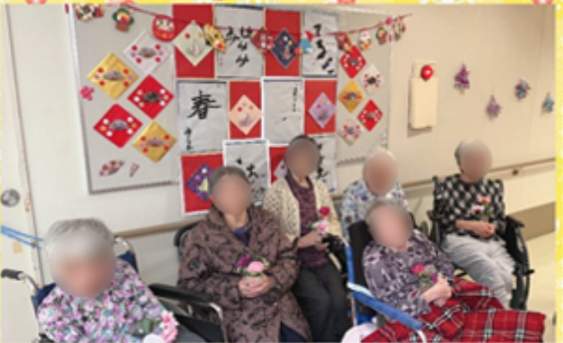
→書き初めの作品を展示しました。お正月飾りもあり、とても華やかですね!今年もよろしくお祈りします♪