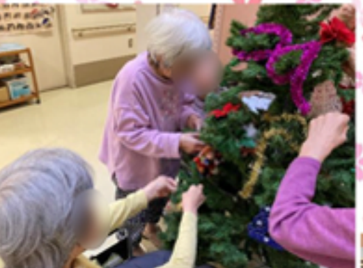
←皆さんで協力してツリーを飾りました! ♪クリスマスカード作り。色鉛筆を使ってとても綺麗に完成しました♪ ↓ツリーの前でお気に入りのワンちゃんとパチリ!