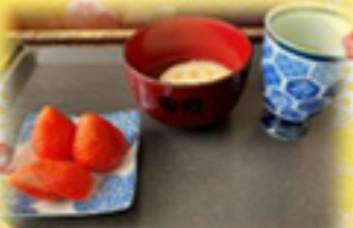
←お汁粉お煎餅入り・デザート添えて♡