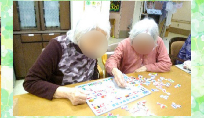
パズルで脳トレです！最近、日本地図や国旗などレベルアップしたものを購入。お二人で協力してチャレンジされていました。