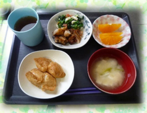
昼食は稲荷ずし。皆さんに詰めていただきました。皆さん手慣れたものです！手際の良さにスタッフが追いつかず(苦笑)。美味しくいただきました！