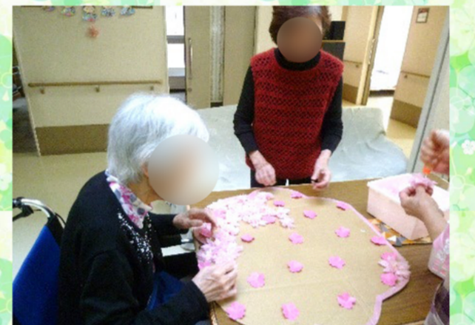
4月は桜🌸木の部分は茶色系の和紙を貼り、花の部分は折って切ったお花紙や色紙を広げたり、貼ったりと何日かに分けて皆さんで仕上げました！