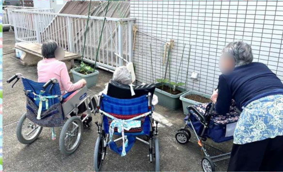
家庭菜園のナス、きゅうり、オクラ・・・「収穫したら食べよう!」と話されてました。楽しみですですね!