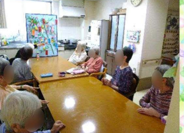
輪っかや短冊などの七夕飾りを作りました。短冊もしっかりご自分で書かれていましたよ！製作時や飾る時もワイワイガヤガヤとても賑やかです！●子さまは飾りながら「ささの葉さ～らさ～♪」と口ずさっていました♪