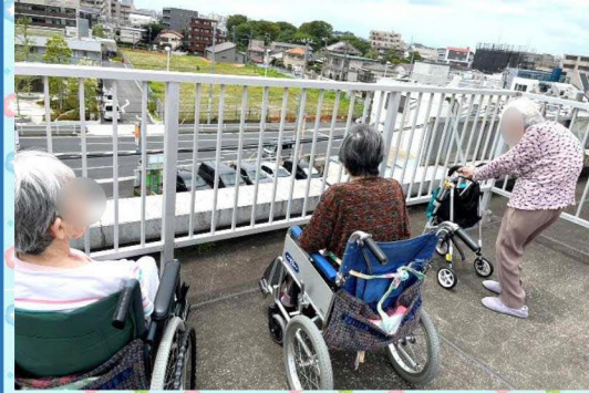
お散歩で屋上へ行きました。目の前には保育園があり、小さな子供たちが遊んでいる姿をよく見かけます♡