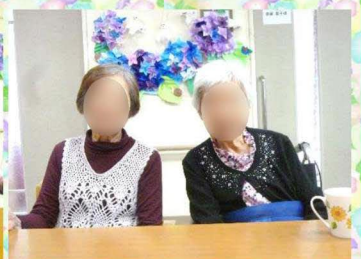
訪問カット「金太郎」さんをお願いしました。皆さん、夏バージョンでスッキリさっぱりしました。とてもお合いですね♥