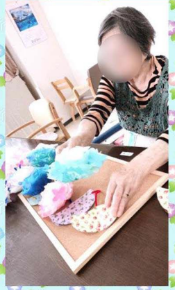
アジサイを玄関に飾りました♪