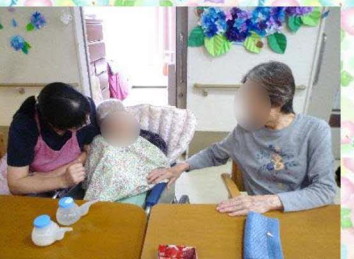
7月の壁面は朝顔。切った折り紙を広げ、すだれの上に糊づけです。