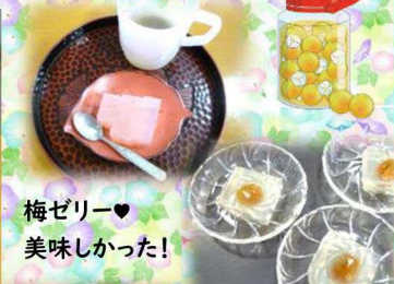
梅ゼリー♥ 美味しかった！