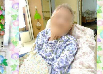
しっかりお目覚めの●子さま♥