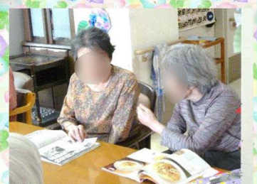
●子様は「ほら！頑張っ！」と●子 カレンダーの日付を貼って下さる●● ラクラクと箸で搦んだ豆をお椀の中へお話をされている●●さまと●●子さまにお声をかけて下さいました。さま。いつもありがとうございます！ 運ぶ●子さま。お見事でした！！ ま。ホッコリとした雰囲気でしたよ♪