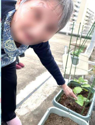
こんなに葉が出てますよ!