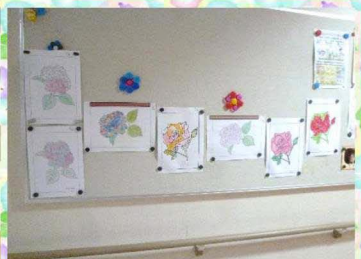
塗り絵にチャレンジです！バラやアジサイなど、ご自分で好きなものを選び、黙々と丁寧に塗られていました。色とりどりの作品の完成です♪