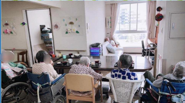
外を眺めながらの昼食です♪ 3Fは明るく外の眺めも良く、シチュエーションが最高ですね! この日のメニューはサンドイッチとフルーツゼリー。皆さんは「のぞみ喫茶」を満喫された様ですよ♡