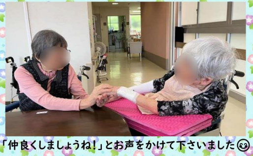
「仲良くしましょうね!」とお声をかけて下さいました😊