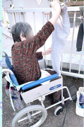
お洗濯物を取り込んで畳んでいただいています