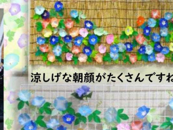
涼しげな朝顔がたくさんですね！