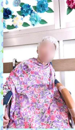
アジサイ飾りの前でパチリ!の子さま😊