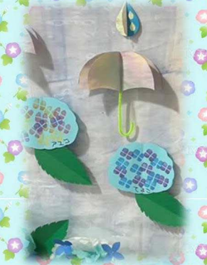
スタンプを押してアジサイを作りました♪