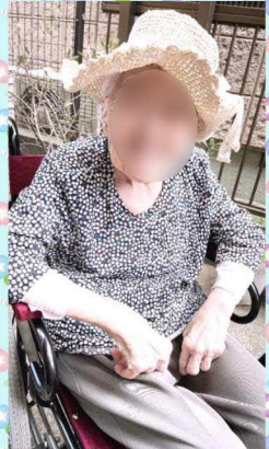
素敵なお帽子・息子さまからのプレゼントです♡