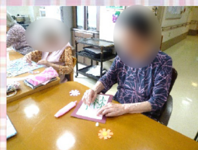
10月の壁面装飾はコスモス。4本の細長い色紙をバランスよく交差して貼りました。たくさんのお花ができました♪