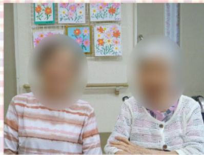
訪問カット「金太郎」さんに切っていただいて、とてもスッキリしました！