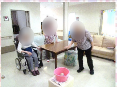
ある日の午後、玉入れに挑戦！一定の距離からバケツに向かってポーン！一位はどなただったでしょうか？♪