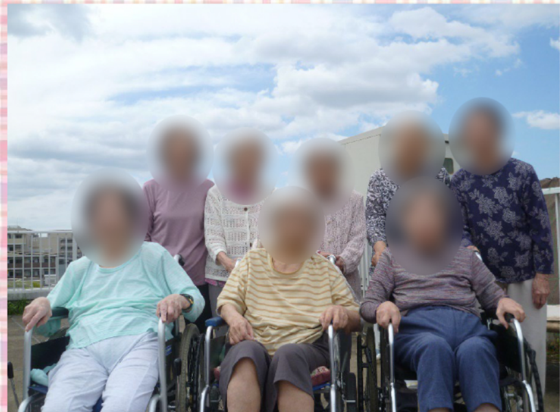
涼くなった屋上でパチリ！この後は女子会トークで大盛り上がり！！