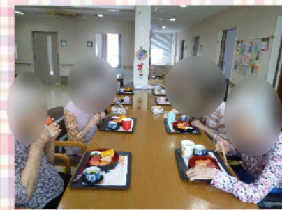
9/18は敬老の日♥ お寿司と茶わん蒸しをいただきました。●子さまは感動されて涙ぐみながらいただいていたました。