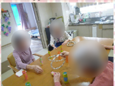
後日、今度は輪投げで大盛り上がり！皆さんニコニコ顔ですが、実際のところはどうぞ(苦笑)？闘志がメラメラ燃えています！