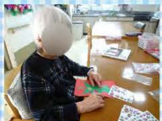
今月の壁面装飾はもちろんクリスマス！リースやツリーなど皆さんで沢山つくりました。フロアの音楽もクリスマスの曲が流れていますよ🎵