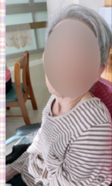
お誕生日会..ケーキでお祝い♪ 皆さま笑顔ですね! 感激の涙..●子さま お得意の歌でお祝いの●子さま 「おめでとう!」の気持ちです♡