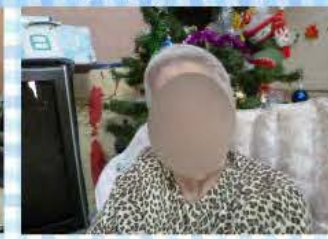
皆さんでクリスマスツリーに飾り付けをしました。「昔は子供が小さかったから家でも飾ったわよ！」などの声が聞こえました。