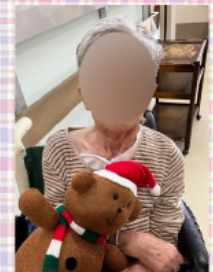
ショートステイの方と意気投合! お三人さま..とても楽しそうでしたよ! 屋上で菜園のチェックをされるのが日課😊 クリスマスの準備🎄