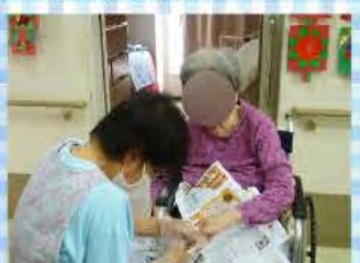
日常の光景・イラストの絵を合わせる神経衰弱。難しいのですよ！カメラを向けるとお茶目な●●子さま● ●子さまは爪切りです！