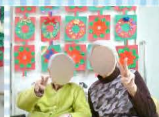
ツリーや飾りの前で好きなポーズで「はい！チーズ！」写真を撮るのにもワイワイガヤガヤ😊とても賑やかです😊