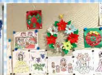
ツリーもOK！壁面もOK！皆さん・トイレへ行かれる途中にも立ち止まって「キレイねえ！」と眺めていらっしゃいます🎵